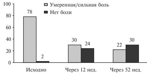
Рис. 1. Динамика боли (% пациентов) в суставах на фоне применения теноксикама 20 мг/сутки у 2963 больных ОА и РА (наблюдение 12 мес). Адаптировано из [20]

Для оценки клинических достоинств теноксикама, помимо РКИ, была проведена серия национальных наблюдательных исследований, в которых этот препарат изучали в реальной клинической практике. Например, в работе британских исследователей тенок-